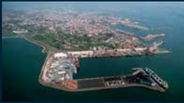
Puerto de Ferrol