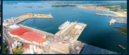
Puerto de Villagarcía