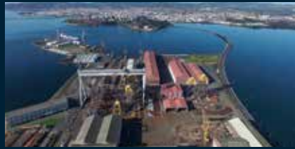
Puerto de Ferrol Instalaciones Navantia-Fene