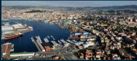
Puerto de Vigo