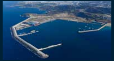
Puerto de A Coruña