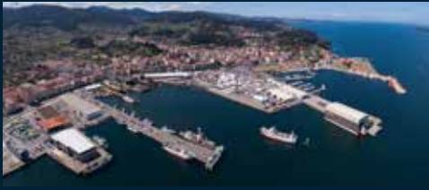
Puerto de Marín